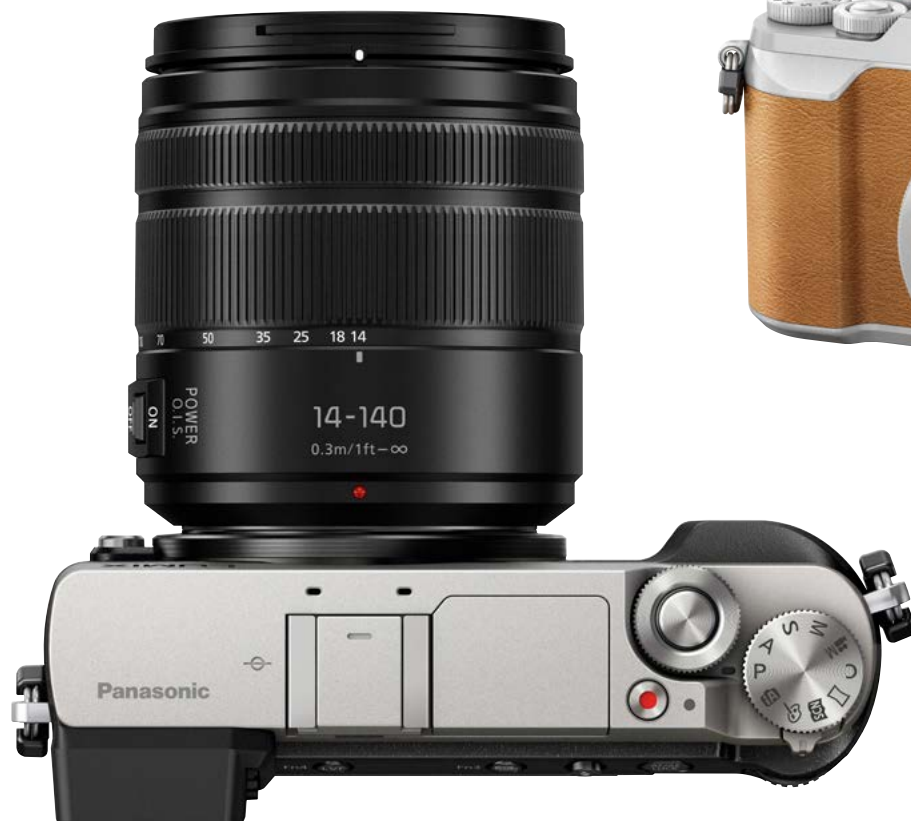
För fotografer som vill ha ett praktiskt reseobjektiv finns en stor 14–140 mm-zoom.