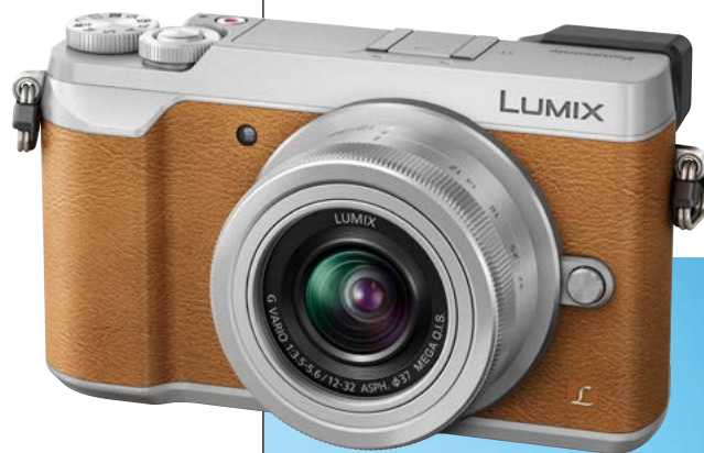
Lumix GX80 finns i svart, svart/silver och brun/silver. Priserna börjar på 6 000 kronor.

slutarstyrning ska orsaka mindre slutarvibrationer. Det antar vi är en fördel med längre slutartider, om inte annat.